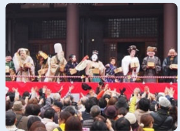
博多座から歌舞伎役者も参加する 「櫛田神社節分祭」。

最後は『博多名物編』です。博多と言えば、辛子明太、長浜ラーメン、水炊きが定番でしょうか。辛子明太の元祖「 ふくや 」(092-261-2981)は中洲大通りの本店がリニューアルして素敵なお店になりました。最近ブレイク中の「 椒房庵 」はもともと久山町のお醤油屋さん。直営のレストラン「 茅乃舎 」(092-976-2112)は予約が取りにくい人気店です。長浜ラーメンは本来港湾労働者の為の塩分補給スピード食なので、決してグルメな食べ物ではありません。それでも本場「 長浜屋台街 」は一度体験して欲しいエリアです。博多水炊きの老舗といえば「 新三浦 」(092-721-3272)と「 水月 」(092-531-0031)ですね。でもちょっと敷居が高いので、リーズナブルにいくなら「 長野 」(092-281-2200)、「 芝 」(092-761-0997)にチェーン展開の「 華味鳥 」(中洲本店092-263-0322)あたりがよろしいかと。この30年でもつ鍋もブレイクしました。六本松の「 月川 」(092-751-1589)は老舗中の老舗です。でも一番人気は大橋の「 やま中 」(092-553-6915)、綱場町の「 もつ幸 」(092-291-5046)あたりです。