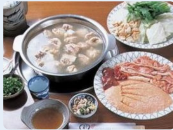
標準的な水炊きの具材。 博多の水炊きは安くて美味しい。