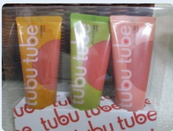
「ふくや」のチューブ明太は パッケージも可愛い。

最後は『博多名物編』です。博多と言えば、辛子明太、長浜ラーメン、水炊きが定番でしょうか。辛子明太の元祖「 ふくや 」(092-261-2981)は中洲大通りの本店がリニューアルして素敵なお店になりました。最近ブレイク中の「 椒房庵 」はもともと久山町のお醤油屋さん。直営のレストラン「 茅乃舎 」(092-976-2112)は予約が取りにくい人気店です。長浜ラーメンは本来港湾労働者の為の塩分補給スピード食なので、決してグルメな食べ物ではありません。それでも本場「 長浜屋台街 」は一度体験して欲しいエリアです。博多水炊きの老舗といえば「 新三浦 」(092-721-3272)と「 水月 」(092-531-0031)ですね。でもちょっと敷居が高いので、リーズナブルにいくなら「 長野 」(092-281-2200)、「 芝 」(092-761-0997)にチェーン展開の「 華味鳥 」(中洲本店092-263-0322)あたりがよろしいかと。この30年でもつ鍋もブレイクしました。六本松の「 月川 」(092-751-1589)は老舗中の老舗です。でも一番人気は大橋の「 やま中 」(092-553-6915)、綱場町の「 もつ幸 」(092-291-5046)あたりです。