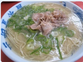
見た目はシンプルこの上ない 「元祖長浜屋」のラーメン。