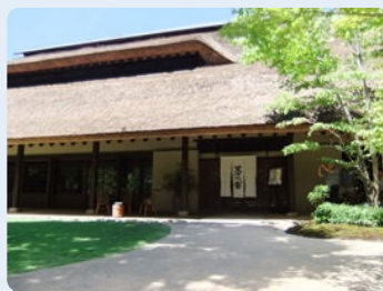
「椒房庵」経営のレストラン 茅乃舎は予約の取れない人気店。