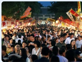
夜店が立ち並び参道が人で埋まる 「笠崎宮放生会」。