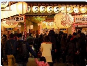
深夜まで賑わう1月の商売のお祭り 「十日恵比寿大祭」。

人気コラム(笑)の『会長の街あるき食べあるき』も今回が最終回となりました。3年余りの連載でしたが、いろんな方から『読んでますよ』とお声掛け頂き、嬉しいやら恥ずかしいやらの日々でした。私はもともと大宰府の出身なのですが、中学時代から福岡に通い、西区に住むようになってから20年。お祭りごとでも今はすっかり福岡人となり、初詣は志賀海神社、商売繁盛で十日恵比寿神社、一番よく行くのが櫛田神社で、節分祭と厄払い、7月の祇園山笠に大晦日の年越祭、あと笠崎宮が春分と秋分のお潮井取りに9月の放生会などなど、福岡市内の神社無しでは暮らしてゆけない日々となっていました。では、これにて街あるきはおしまいです。拙文を読んで頂きました皆さまには心より感謝申し上げます。