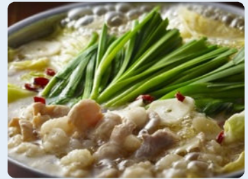
狭くて古いが、味は太鼓判の老舗 「もつ鍋月川」。