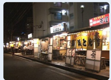
天神から歩いて15分の 「長浜ラーメン屋台街」。